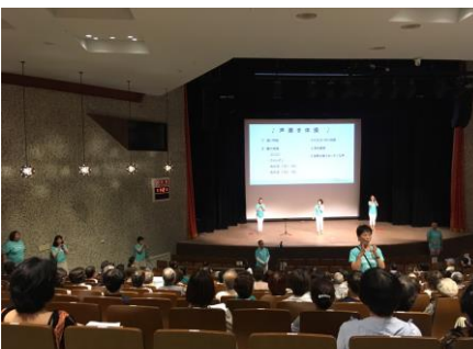
⑧ 誰でも楽しめる声磨き体操 ドレミの歌に合わせて♪

9月23日(月祝)に埼玉会館小ホールで催された【第1回 100万人の声磨きフェスティバル】は230人のご参加の下、専門医による「のどの老化」のレクチャーあり、のどを鍛える声磨きトレーニング体験あり、のどを鍛える大切さをお一人お一人に実感していただける機会となりました。最後はドレミの歌に合わせた声磨き体操で楽しく盛り上がりました！御賛同いただいた皆様、応援ありがとうございました。