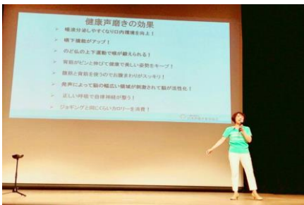
⑥ 声磨きの効果について これまでの事例から