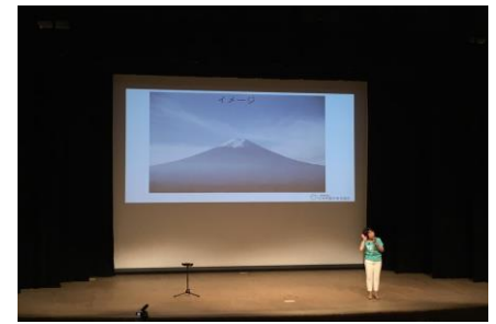
⑦ 良い声は良い呼吸から 呼吸に声をのせて～！