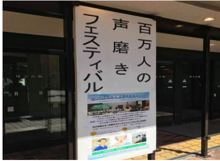
① さあ、これから始まります！ 秋晴れでよかった～(^^)