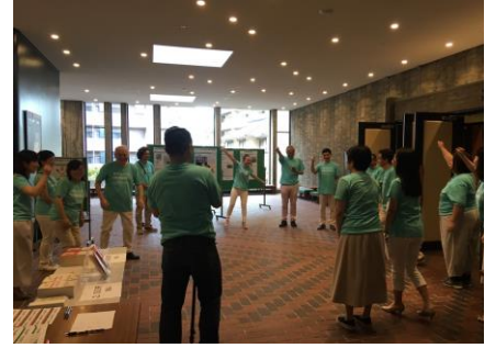
③ 開演直前、スタッフの心を ひとつにして！