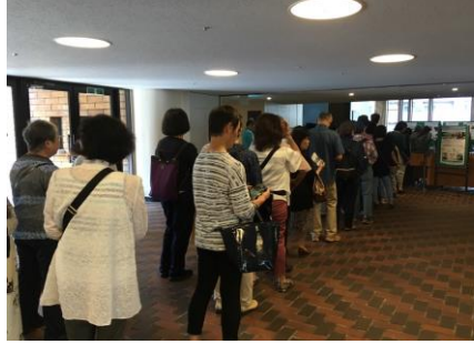
② 開場30分前からなんと長蛇の列！