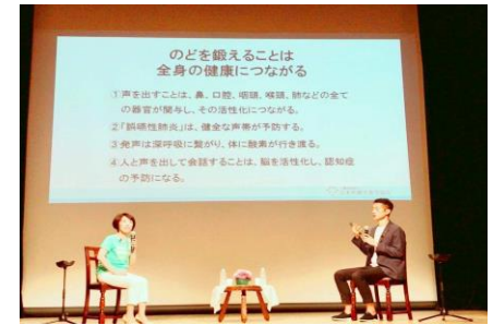
⑤ のどを鍛えることは 全身の健康の鍵を握る