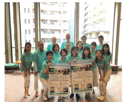
⑩ みんなの力で大成功！