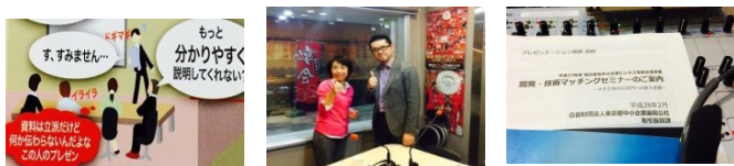
毎週日曜日 21:00～21:55 再放送 毎週水曜日 10:00～10:55

FM78.3MHz REDS WAVE インターネットでお聴きいただけます。 全世界に発信、11/8から周波数が変わりました。 聴取エリアがさいたま市全域&周辺エリアに！！