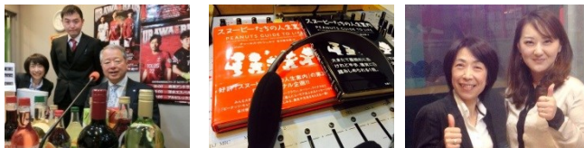
毎週日曜日 12:00～12:55 再放送 毎週水曜日 10:00～10:55